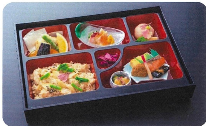
桜まんかい弁当 1,500円(税込)

★ご予約特典★ 2日前までにご予約されると、完全個室でのお食事をお楽しみいただけます