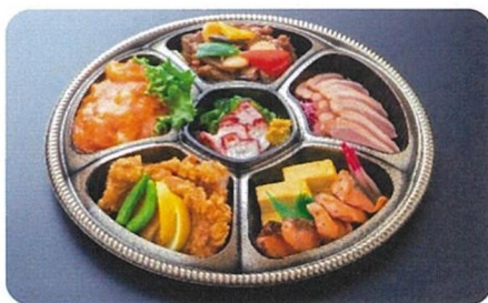
萬花京 & 開運亭 (和中華)