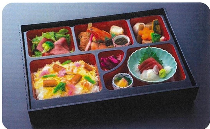
春らんまん弁当 2,500円(税込)

春の味覚をたくさん盛り込みました 今年の春は開運亭でゆっくりお花見を楽しみませんか？